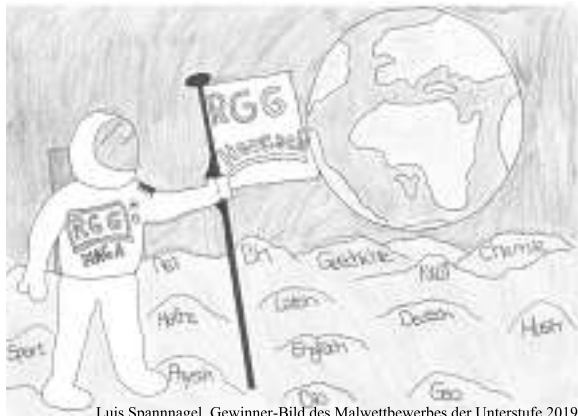
Luis Spannagel. Gewinner-Bild des Malwettbewerbes der Unterstufe.2019