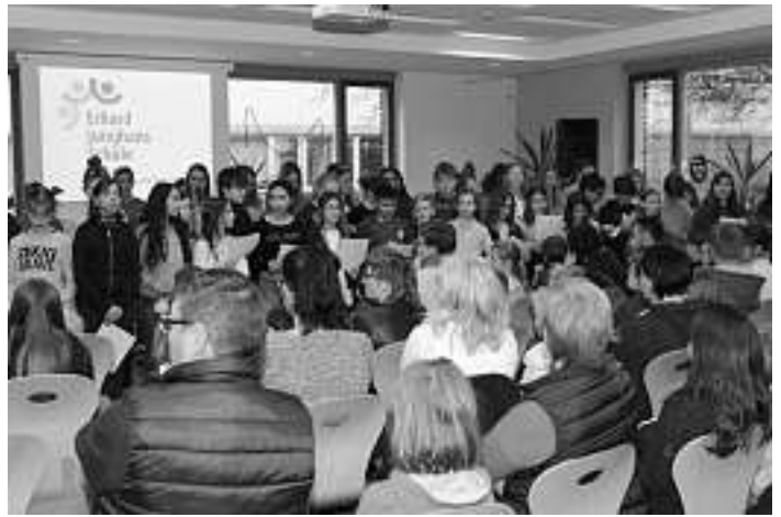
musikalische Begrüßung in der Mensa