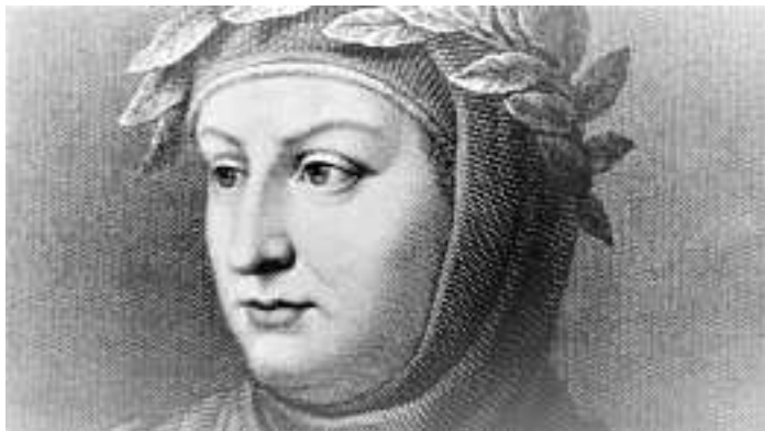
Der Dichter und Schriftsteller Giovanni Boccaccio

Zum historischen Hintergrund weiß man etwa Folgendes: Wie das Corona-Virus hat auch die Pest ihren Ursprung vermutlich in China. Dort war die hoch ansteckende Krankheit 1332 ausgebrochen und wurde über Kaufleute zunächst in europäische Hafenstädte eingeschleppt. 1348 erreichte sie Florenz. Giovanni Boccaccio war ein berühmter Sohn der Stadt. Neben Petrarca und Dante zählt er zu den berühmtesten Dichtern Italiens.