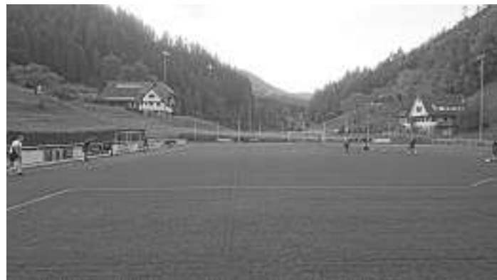
Trainingsstart mit Abstandsregelung

Stand jetzt findet jeden Dienstag um 19:00 Uhr ein Training (mit Einschränkungen gemäß der Gesetzgebung) für Aktive Spieler statt.