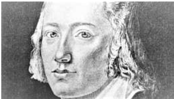
Der Lyriker Friedrich Hölderlin (1770-1843)

Rüdiger Safranski zitiert in seinem neuesten Buch über Hölderlin einen anderen Vers: „ Komm!, ins Offene, Freund! “ aus dem Gedicht „Gang aufs Land“. Obwohl unvollendet, ist diese Elegie berühmt geworden, schon wegen ihres die Sehnsucht vieler Menschen spiegelnden Eingangs-Anrufs: „ Komm!, ins Offene, Freund! “ Es geht in diesem Gedicht um das „Landleben“ um Stuttgart herum: Weinberge, Wald und Wiesen, blauer Himmel; das sind Symbole, für das, was Hölderlin „Das Offene“ nennt. Von den Ideen der französischen Revolution berührt war für Hölderlin dieses Offene in all seinen Gestalten Gegenstand der Sehnsucht, war das grundlegende Thema seiner Werke.