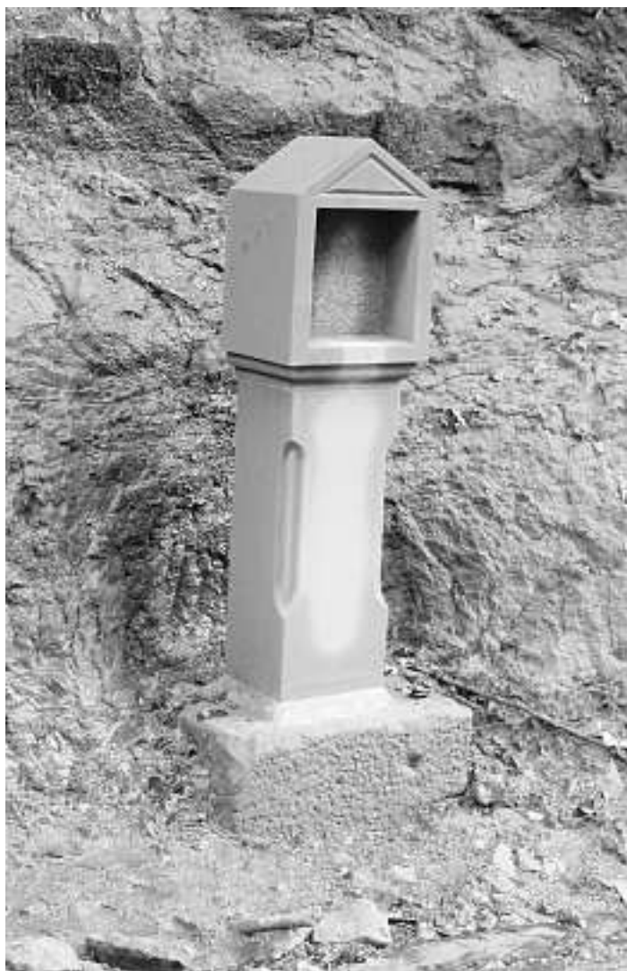
Der von Bildhauer Uwe Hagel aus Reinerzau neu gefertigte Bildstock „Lay“

Das war wieder einmal ein klarer Beweis, dass vonseiten der Bürgerschaft am Erhalt der historischen Kleindenkmale nach wie vor ein sehr großes Interesse besteht.