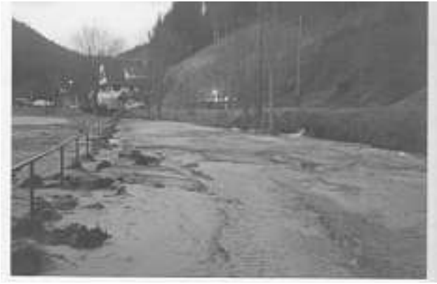
Das Jahrhunderthochwasser 1990 zerstörte den kompletten Sportplatz