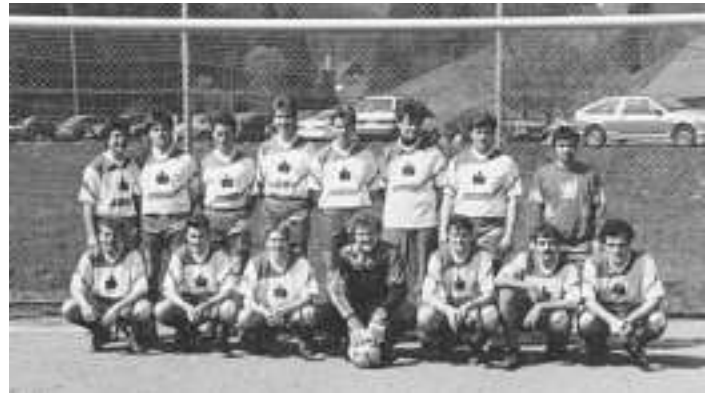
Die Erste Mannschaft im Jubiläumsjahr 1992

vielen fleißigen Helferinnen und Helfern aus und war ein Meilenstein in der Geschichte des SC Kaltbrunn.