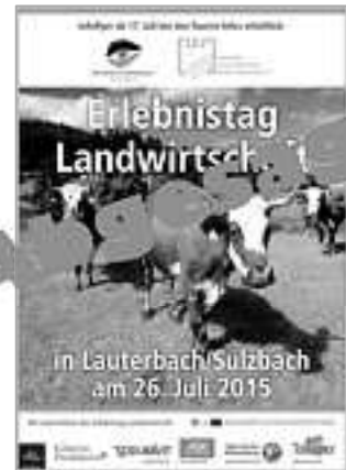
Plakat Erlebnistag Landwirtschaft 2015.

Der für den 19. Juli 2020 geplante Erlebnistag Landwirtschaft musste leider aufgrund der aktuellen Situation abgesagt werden. Wir hoffen, den Erlebnistag im kommenden Jahr nachholen zu können.