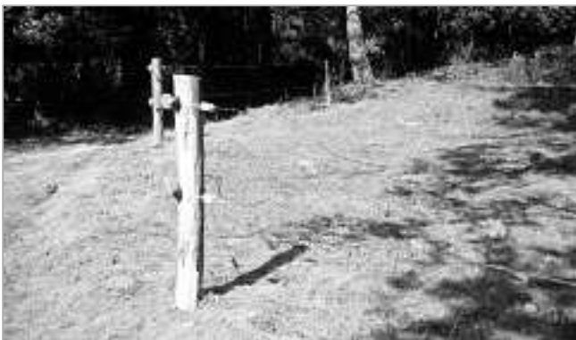
Geförderter 2-litziger Rinderzaun.

Bei der Bedarfsermittlung für das Weidezaunprojekt Wolfach haben sich 8 Interessenten mit ca. 40 ha einzuzäunender Fläche gemeldet. Es handelt sich mehrheitlich um Rinderhalter, Schaf- und Ziegenhalter nehmen überwiegend die Förderung aus der Wolfspräventionskulisse in Anspruch (siehe nachfolgend).