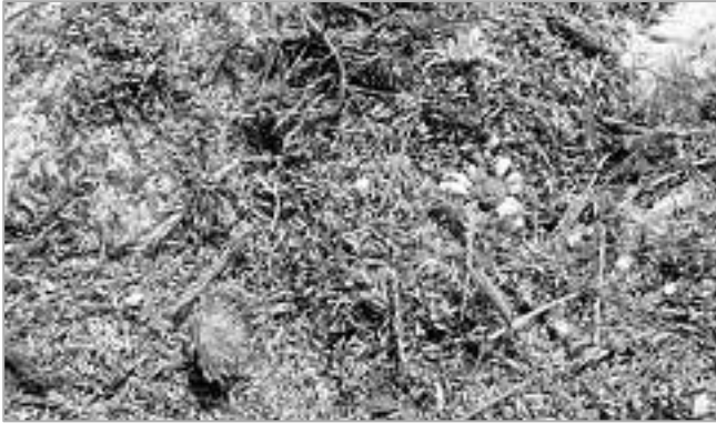
Von den Spenderflächen geerntetes Druschgut.

Das Druschgutprojekt von LEV Mittlerer Schwarzwald und LEV Rottweil wurde in diesem Jahr fortgesetzt.